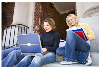
Academia Conexiones 9-12 A Opciones de Programa de Mejores Prácticas de California para la Educación

un plan de aprendizaje efectivo, individualizado.